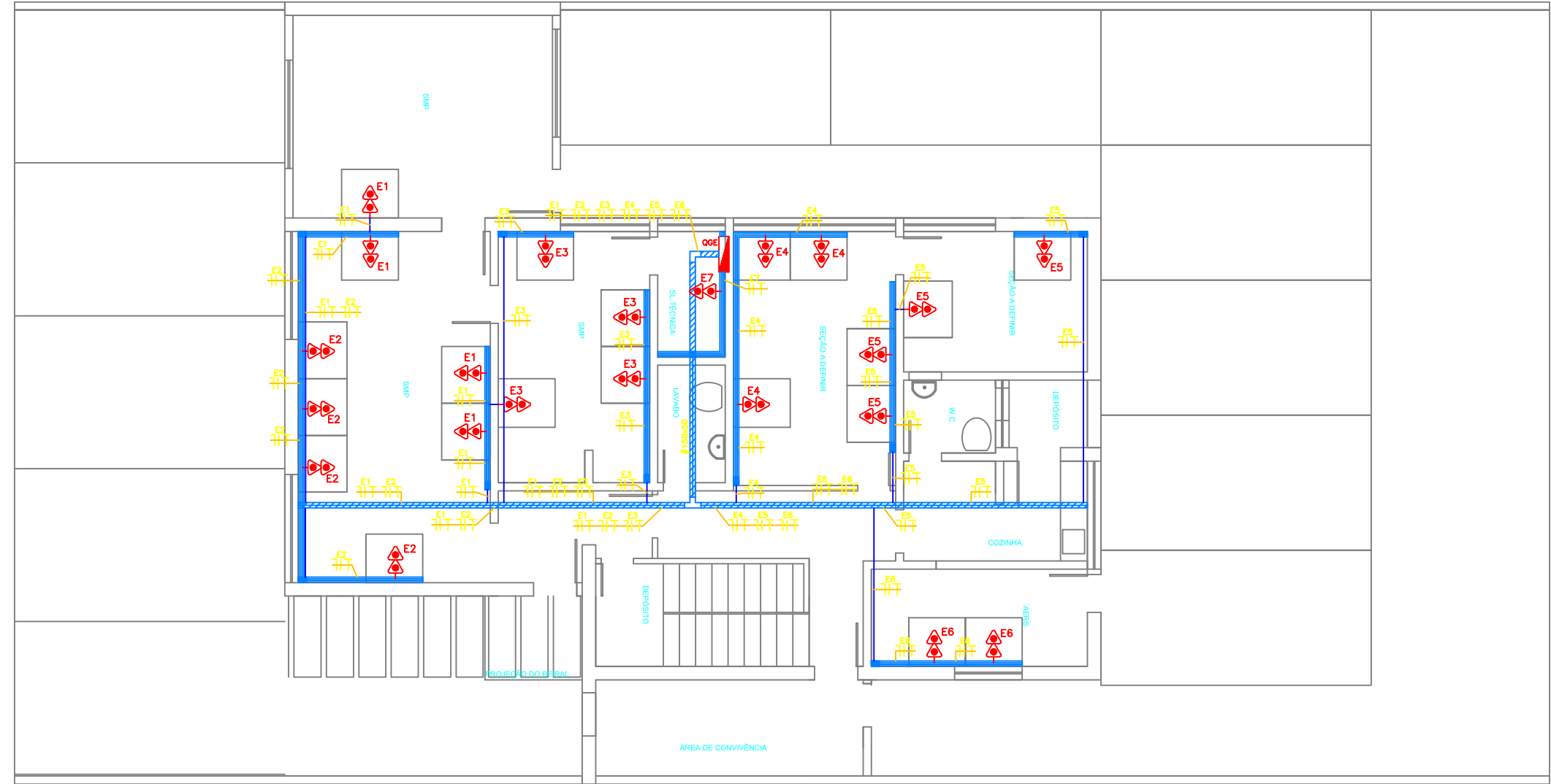
PLANTA BAIXA - TÉRREO ESCALA 1:50